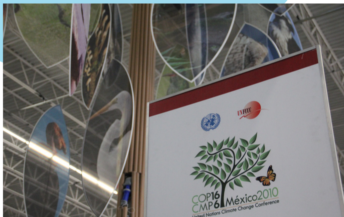
autor: Friends of the Earth International

proto označit výsledek konference v mexickém Cancúnu v závěru roku, kde mnoho z dlouho připravovaných ujednání dostalo podobu závazných rozhodnutí a státy projevíly vůli dosáhnout právně závazné dohody v roce 2011. V průběhu roku jsme se účastnili celkem čtyř týdnů vyjednávání o detailech klimatické smlouvy. Práce CDE se zaměřila na informování českých médií [→] a dalších nevládních organizací o vývoji jednání a na místě jsme spolupracovali s mezinárodními nevládními organizacemi.