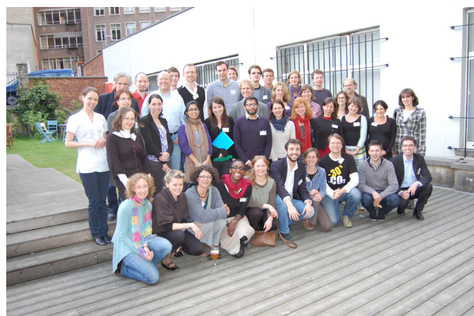
Valná hromada Climate Action Network Europe

V rámci sítě nevládních organizací Climate Action Network Europe jsme se účastnili několika strategických setkání a odborných seminářů o mezinárodní klimatické politice a emisním obchodování.